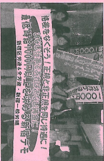
2014年5月23日 新宿駅西口最賃デモ